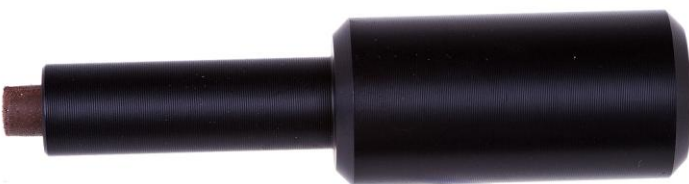
AT73 Инструмент для полировки седла клапана ВД

Регулировка положения седла клапана 2-й ступени Flight под давлением.