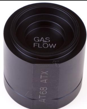
AT68 Ключ для настройки 2-й ступени АТХ

Снятие/установка фронтальной крышки и внутреннего прижимного кольца мембраны 2-й ступени (октопуса) Egress. Регулировка положения рычага клапана 2-й ступени (октопуса) Egress.