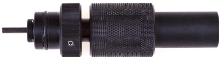
AT76 Ключ для микро регулировки 2-й ступени Flight

Калибратор для установки высоты рычага 2-й ступени регулятора Flight.