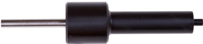
AT53 Ключ для установки/снятия седла клапана 1-й ступени

Снятие и установка седла клапана 2-х ступеней регуляторов серии ТХ, АТХ, ХТХ.