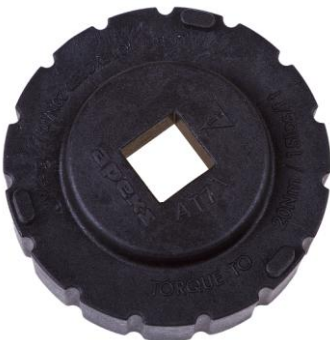
AT71 Ключ для крепежа мембран 1-й и 2-й ступеней Flight

Калибратор для установки высоты рычага 2-й ступени регуляторов серии TX100.