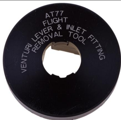
AT77 Комбо-ключ Вентури 2-й ступени Flight

Установка блока клапана 2-й ступени в корпус 2-й ступени регулятора Flight. Тонкая регулировка усилия на открытие клапана 2-й ступени регулятора Flight.