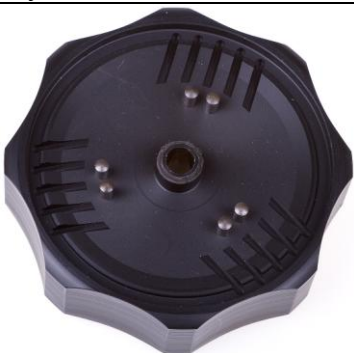
AT62 Ключ для фронтальной крышки 2-й ступени Egress

Установка/снятие съемного седла клапана ВД 1-й ступени FSR (АТХ200, ХТХ200, Black Pearl, Tungsten)