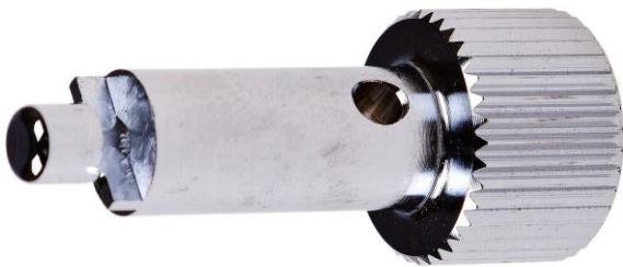
AT51 Ключ для установки седла клапана 2-й ступени

Вкручивается в порт СД всех 1-х ступеней регуляторов Areks для зажима их в тисках. Также используется для разборки/сборки блока рычага клапана 2-й ступени (октопуса) Egress.