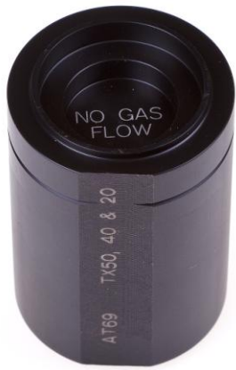
AT69 Ключ для настройки 2-й ступени TX50,40,20

Калибратор для установки высоты рычага 2-й ступени регуляторов серии TX50,40,20.