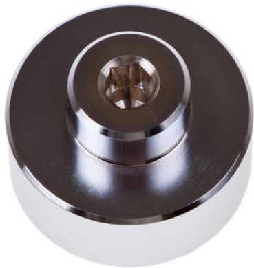
AT74 Ключ для установки трубки Yoke 1-й ступени Flight

Снятие/установка крепежного винта трубки YOKE 1-й ступени регулятора Flight.