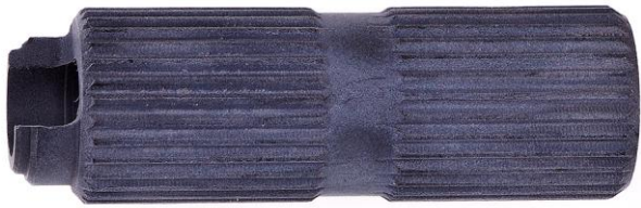
AT45 Ключ для тонкой регулировки 2-й ступени АТХ

Снятие/установка регулировочного винта пружины клапана 2-й ступени регуляторов серии АТХ