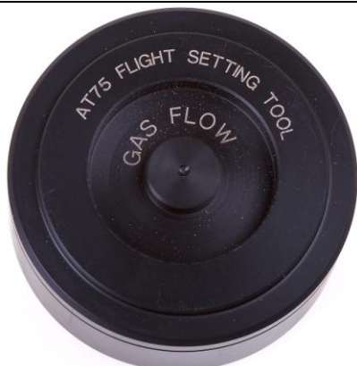
AT75 Ключ для настройки 2-й ступени Flight

Снятие/установка крепежного винта трубки YOKE 1-й ступени регулятора Flight.